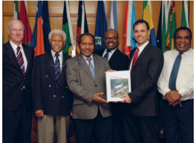
Ofisal presentasen bilong Hailens Haiwe, stretim na wokim haiwe rot kamap gut repot

Rot long go insait long graun em i wanpela bikpela samting long wok bilong Projek. Risetelmen na kompensesen wok bilong go insait long graun i go het insait long dispela kwata, wantaim moa luksave long Hevi Hol Rot, Kopeanda Lenfil Sait, Wellpad Ekses Rot, Komo Ples Balus, Hides Ges Kondisening Plent, Hides Kwari 1 and Hides Kwari 3 na sauten hap bilong paiplain. Projek i tok pait pinis, na karimaut planti long ol In-Prinsipal Kompensesen Agrimen wantaim 82 In-Prinsipal Kompensesen Agrimen ol mausman bilong ol hauslain o klen na Projek Menesmen yet i sainim pinis.