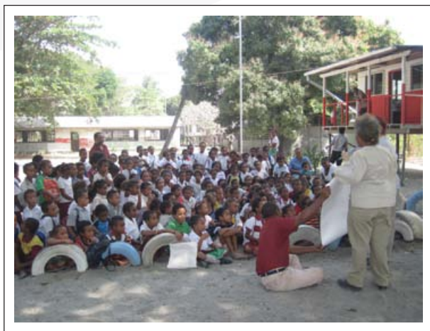
Literasi developmen bilong ol pikinini