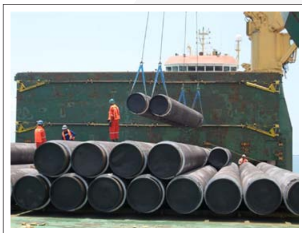
Tebol 1 – Ol Kontrak na bikpela wok konstraksen